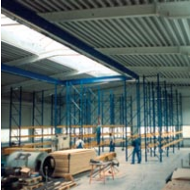
Neubau der Halle 2 im Jahr 1998: 500 Palettenplätze entstehen.

Konzentration auf die Stärken: lösungsorientierte Beratung, Service und Reparatur.