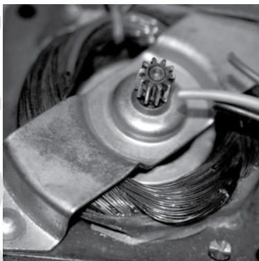
Produktion: 1.000 Antennen- drehmotoren am Tag