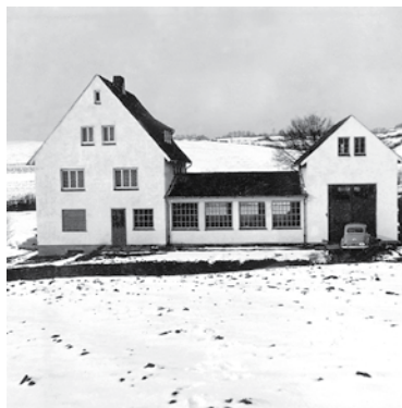
Neues Firmengebäude 1954

Reparatur und Verkauf von Elektromotoren; Entwicklung, Herstellung und Verkauf von Sondermotoren.