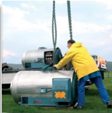
Austausch 1 MW Windgenerator