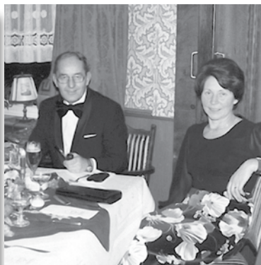
25. Firmenjubiläum 1975