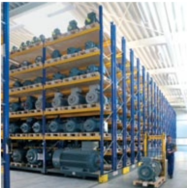
Neubau der Halle 3 im Jahr 2005: „Hobbyraum“ mit 3.000 Palettenplätzen