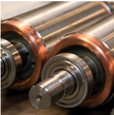
Energiespar-Rotoren + Motoren