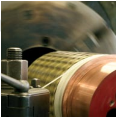
Aufziehen der Bandage