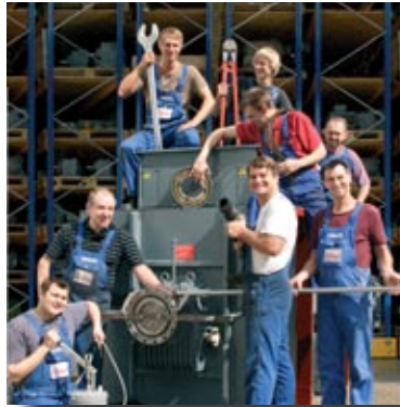
Auch für Große gut gerüstet

2010: 40 Mitarbeiter, davon 4 Meister, bringen kleine und große Motoren wieder zum Laufen (0,06 - 6000 kW).